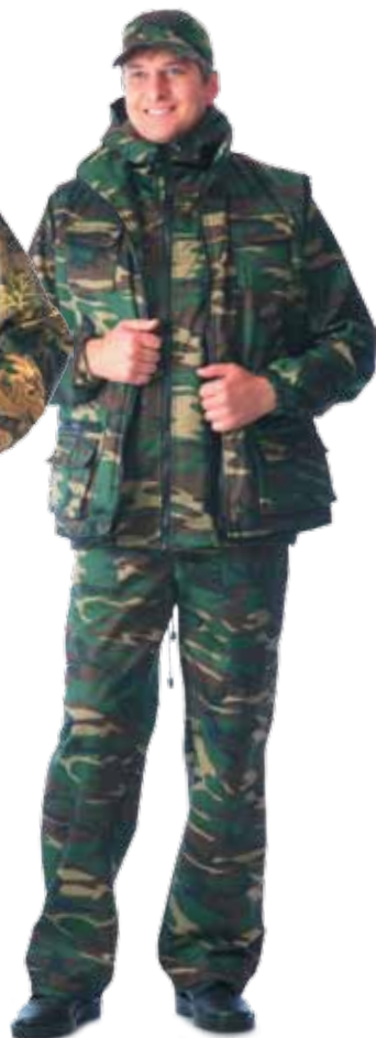
11181 КМФ «Лес»