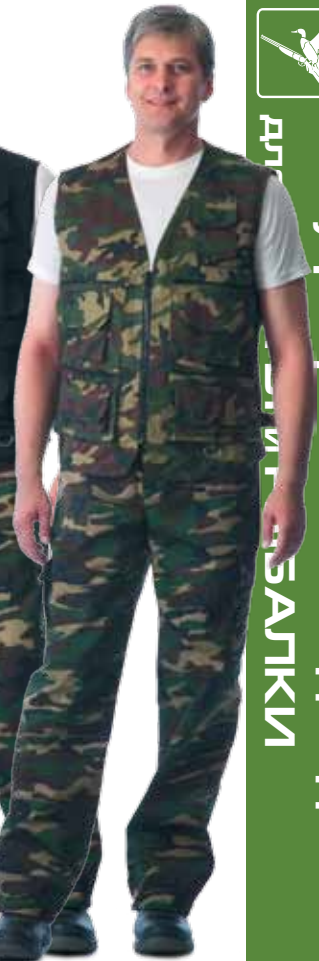
10077 КМФ «Лес»