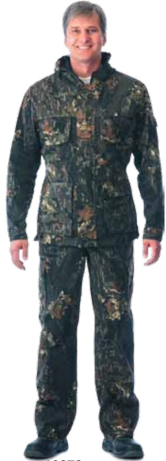
10272 КМФ «Лес»