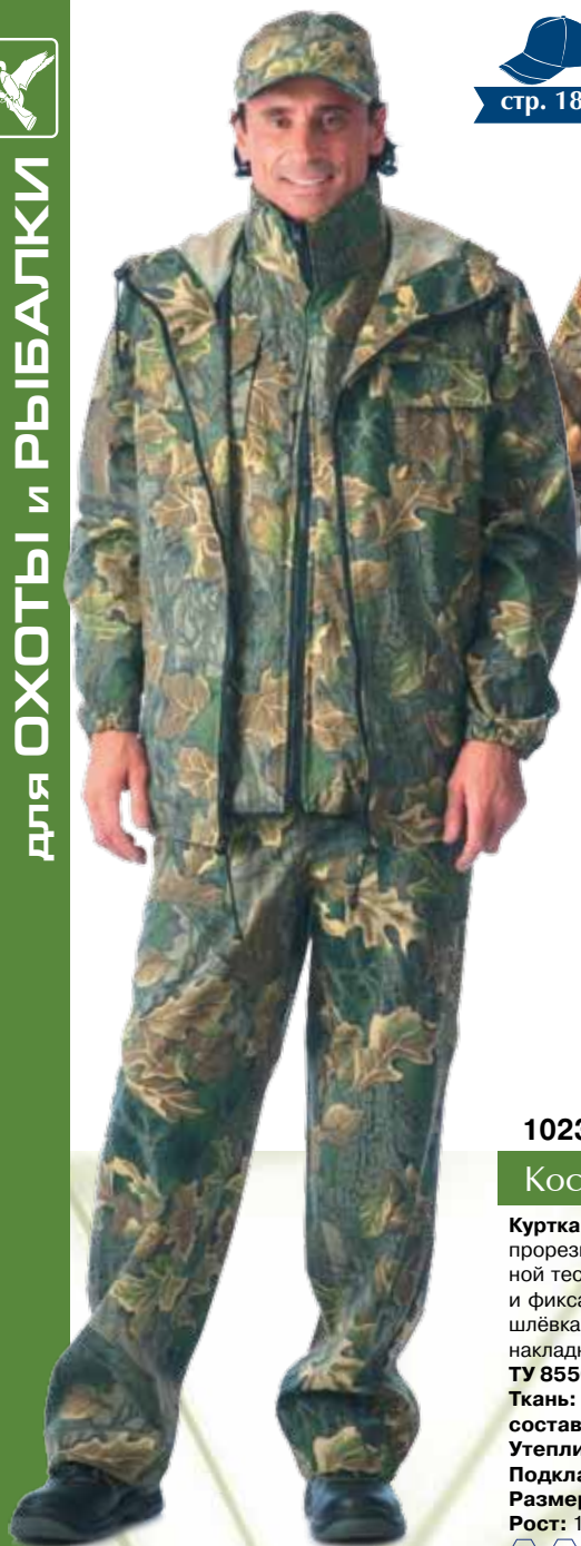
10238 КМФ «Дубок» зелёный