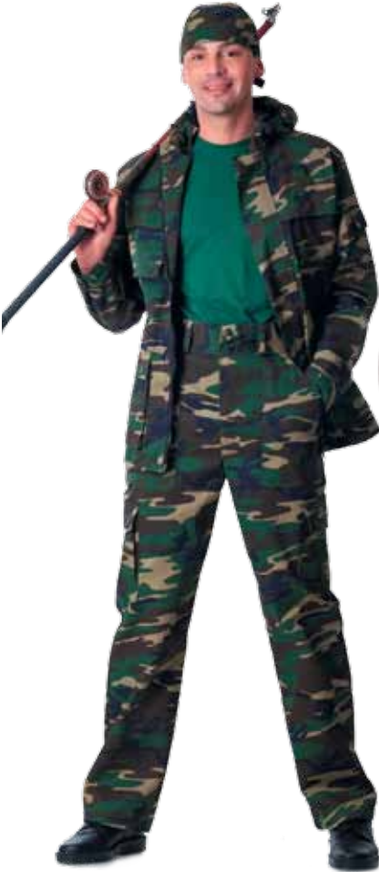
10358 куртка, КМФ «Лес»