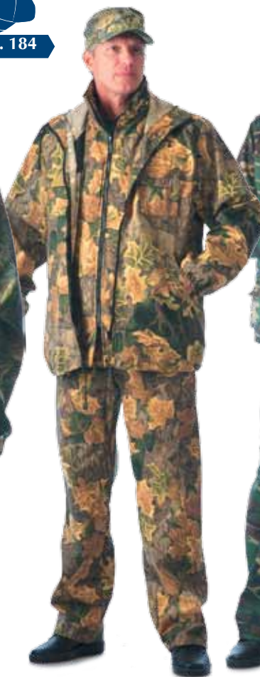
10237 КМФ «Дубок» жёлтый