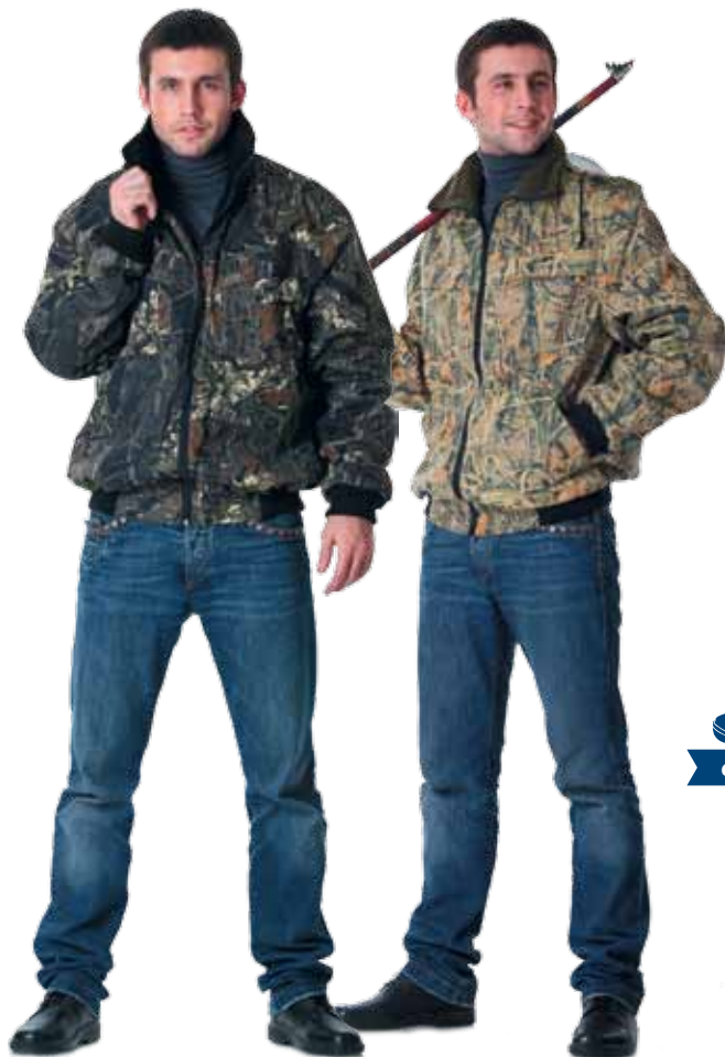
10349 КМФ «Мох»